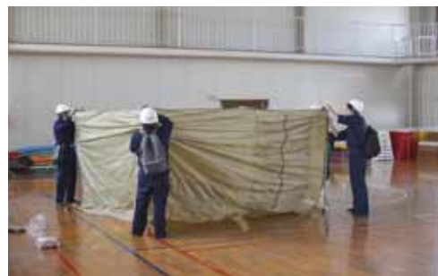
体育館でのパーティションの設置。