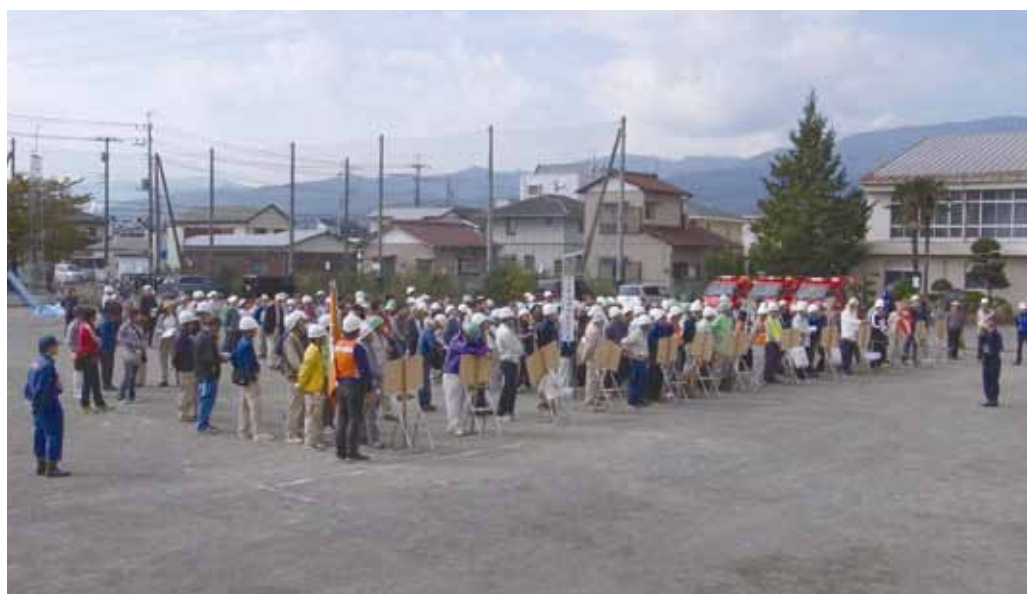
広域避難所の桜井小学校の校庭。