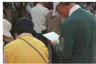
実際に避難者カードに記入する。