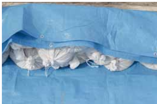
土のうを実際に手にとったり、作り方、保管の方法を学びました。