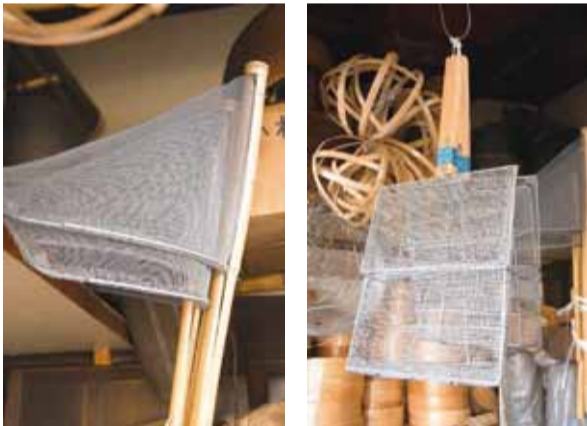
左/大の釣り好きという、横溝さん。同じく釣り好きだった三代目が考案した魚とり網は、ひと夏で500本を売り上げたことも。魚とり網(大) ¥3,000(税別) 右/あられや銀杏をいれる道具も手作り。¥4,500(税別)

50年、60年、使い続けられるという横溝さんの曲物道具。修理の依頼も受けている。永く使っていく中で、道具に味が出てくるのも楽しみになりそう。