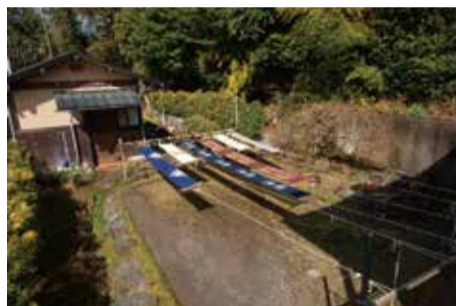
工房とギャラリーをつなぐ中庭に型染めが干されている。この日は工房の生徒さんたちの作品が気持ち良さそうに風に揺れていた。