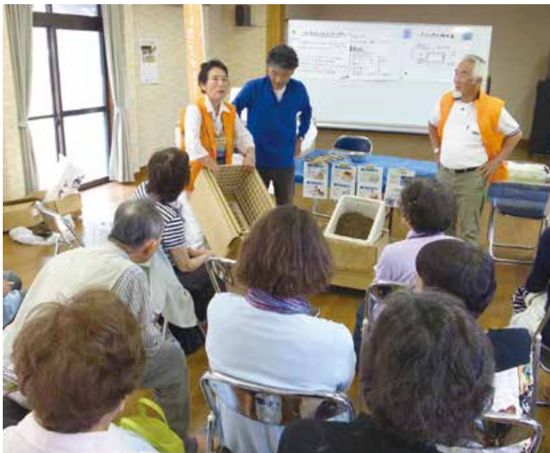
同地区でコンポスト作りに取り組まれている方も説明に参加し、長持ちさせるコツを伝授。