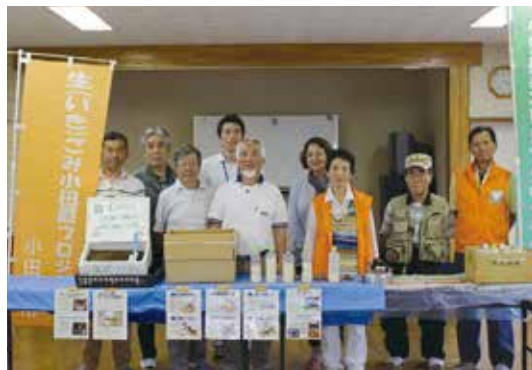
今回の説明会を行なった、小田原生ごみクラブの皆さん。