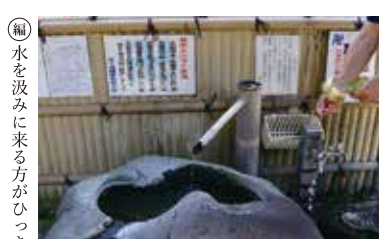
水を汲みに来る方がひっきりなしにきていました。

〈穴部用水 MAP⑦〉大坂屋さんと府川商店さんが話された「川」というのは、「穴部用水」のこと。府川商店の裏を今でも流れています。狩川の水を飯田岡で取り入れ、かつては甲州道に沿って流れて街道のなりわいを培いました。にぎわいの傍にいつも水あり。