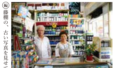
藤棚の、古い写真を見せてくださいました。

〈府川商店 MAP⑤〉カーブの先のタバコ屋さんには仲良しご夫婦のお店。昭和14年創業当時、店の前には川が流れていて、立派な藤棚が設えられ、花の時期には道ゆく人のため息を誘いました。その藤が今、この先の足下地蔵尊に移植されています。