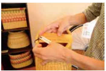
ガーナ製の手編みバスケットはイネ科の植物を使っているのに雨にも強いそうです。

〈まいど扇町 MAP⑨〉オレンジ色のお店の前にはいつも目を引く看板があつて、今日は「B 魚のかばやき」だけの表示。気になる「A」はハンバーグで売り切れ、残念。扇町商工振興会直営のコミュニティーショップです。さんまのかばやき、文句無く美味しかったです!