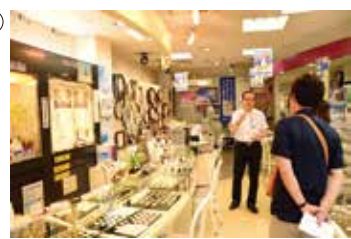
時計の修理のお客さんも多いそうです。

〈大坂屋製粉 MAP③〉「店の前には川があつてね」と教えてくれたのは、喜寿をこえてなおハツラツなご主人です。明治20年創業で、建物も昭和8年頃の出行造り。昔は山王川に設置した水車で、麦や大豆の製粉をしていたそうです。