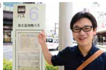
バスは一時間に一本くらいです。

〈小田原駅東口バスのりば MAP①〉しかしこの商店街（正式には扇町商工振興会）の知名度が低いのは、歴史のジレンマでしようか、自動車社会になって以降、交通の便が良くないのです。なので今回は小田原駅からこのバスに乗って入り口まで行きますよ。