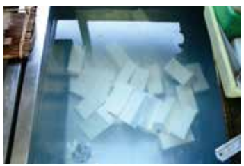
毎日豆乳を買い常連さんも多いのだそう。

〈コスナサイクル MAP⑩〉すっきりした店内には数台のかわいい自転車と修理中のママチャリ。新しいお店に見えて、実はご当主で3代目。「楽しく乗ればいい」というご主人ですが、調整には独自の「コスナルール」があるそうです。