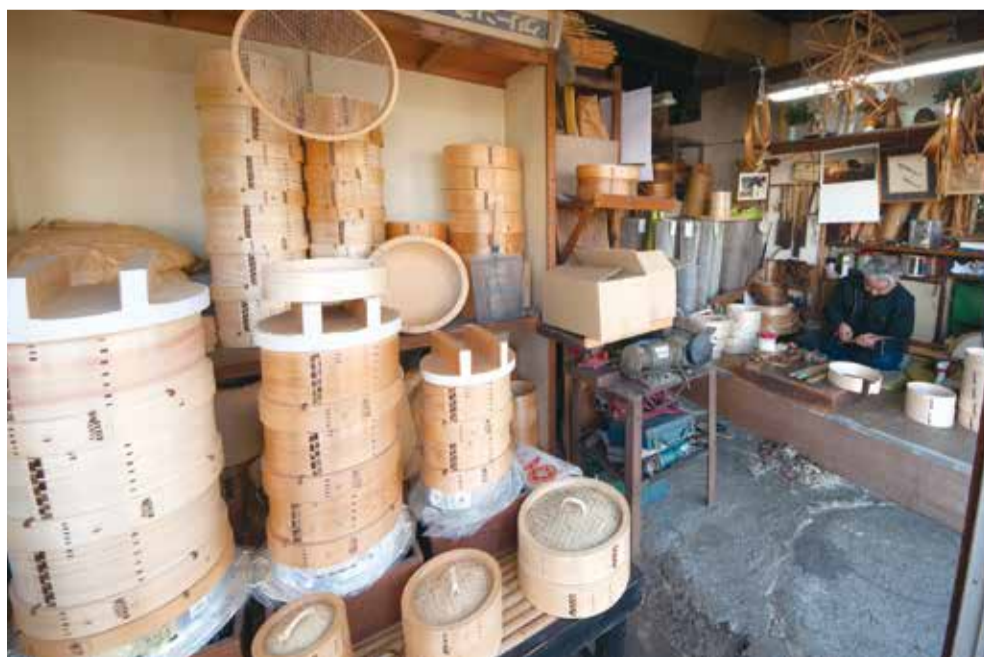
写真・文 おとなりさん編集部